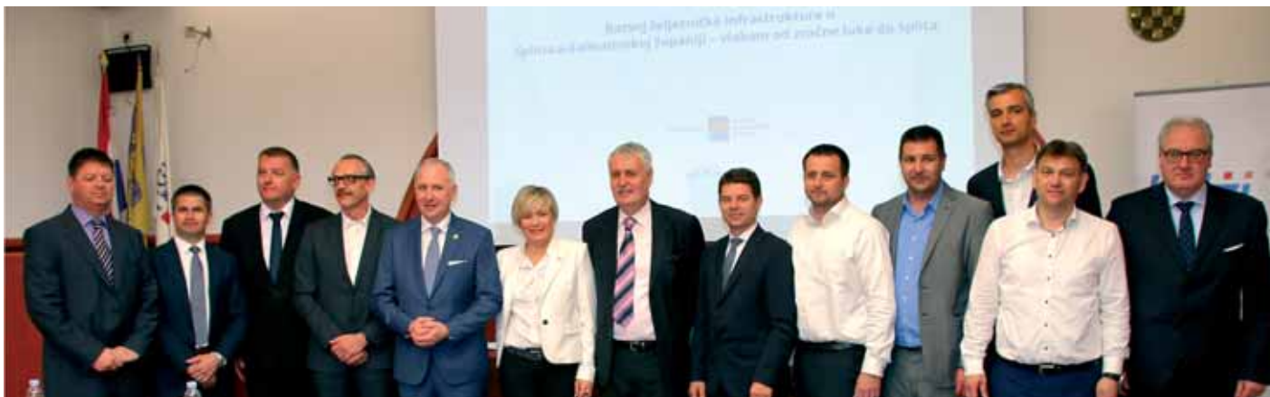
Sudionici okruglog stola

U HGK – Županijskoj komori Split 30. travnja održan je okrugli stol o razvoju željezničke infrastrukture u Splitsko-dalmatinskoj županiji koji su organizirali Hrvatsko društvo željezničkih inženjera, Grad Split, HGK – ŽK Split i HŽ Putnički prijevoz, a pod pokroviteljstvom Splitsko-dalmatinske županije.