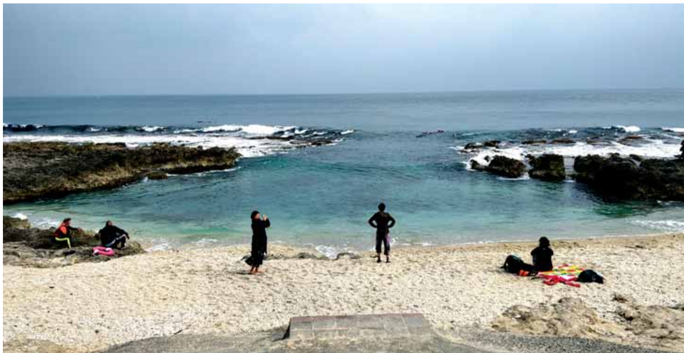
Liuqiu - u potrazi za morskim kornjačama