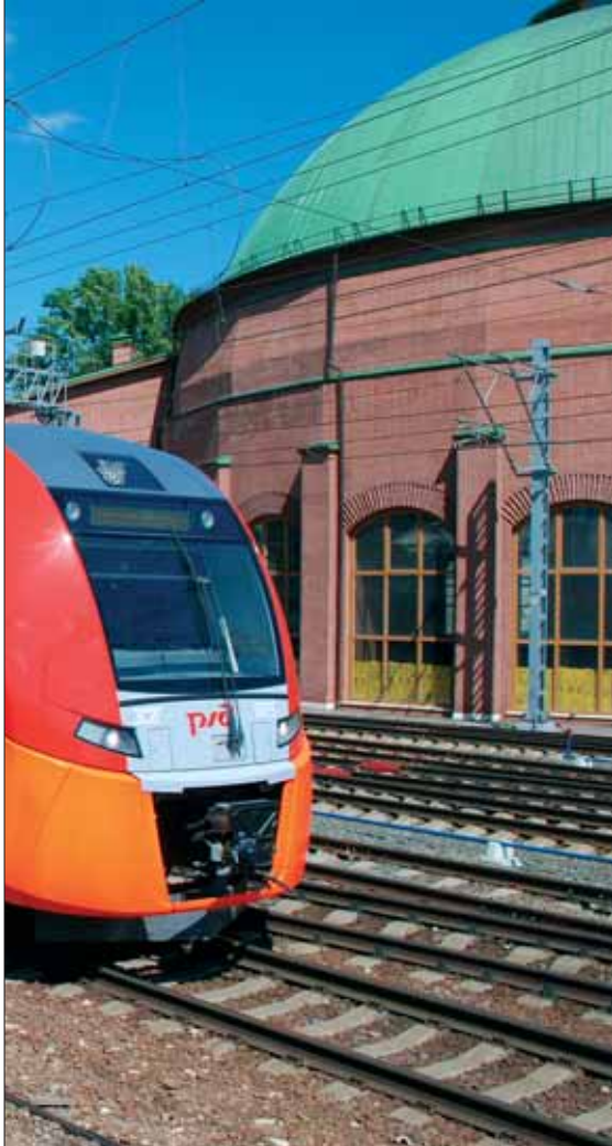
Elektromotorni vlak Lastočka

kve i Berlina. U vlakovima Talgo koje Ruske željeznice brendiraju nazivom Striž (čioipa) postoje dvije vrste smještaja – dnevni i noćni. Vlakovi Striž koji voze prema Nižnjem Novgorodu opremljeni su dnevnim interijerom, dok su vlakovi koji voze prema Berlinu opremljeni noćnim interijerom.