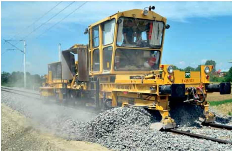
Planiranje zastorne prizme na dionici Greda - Sisak

Na dionici Greda – Sisak tijekom osam 36-satnih tzv. zatvora pruge pružno postrojenje AHM tvrtke Swietelsky ugradilo je tamponski sloj debljine 40 cm u duljini od 5,9 km i s radovima će nastaviti tijekom stalnog tzv. zatvora pruge od sredine svibnja do 19. lipnja na dionici između Sisak Capraga i Sunje. Nakon što je između Grede i Siska strojno ugrađen novi tampon,