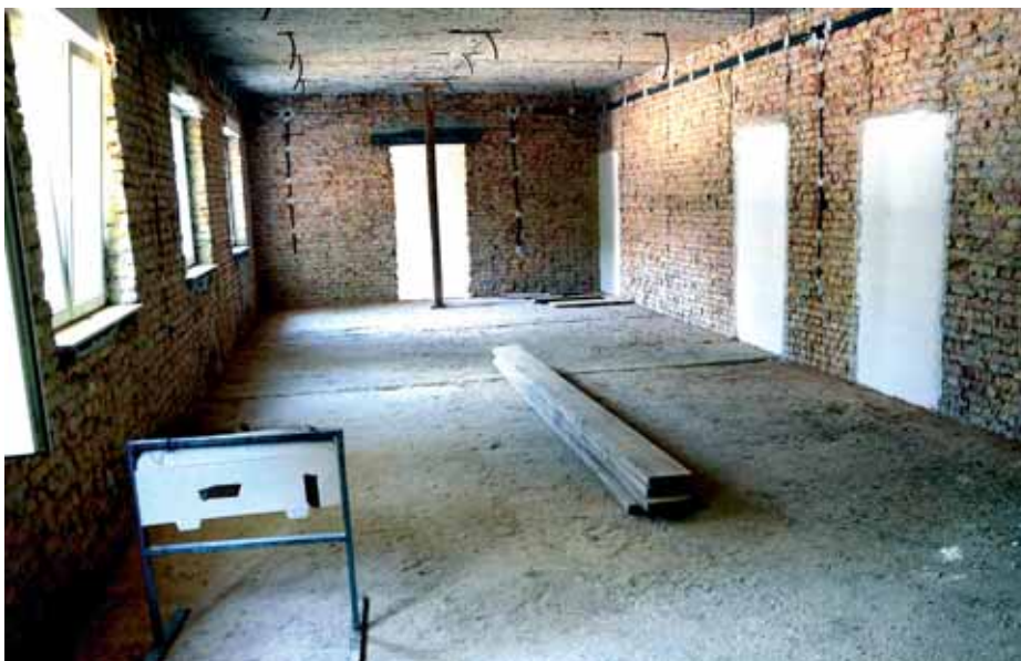
Radovi na uređenju prostorije za daljinsko upravljanje prometom

srpnja 1980. godine. U Kninu živi od 1995. otkada je doselio iz Splita i nije zažalio: