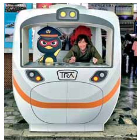
U kolodvoru Hualien

Prehodali smo nacionalne parkove u gorjima, istraživali velike i male gradove, uživali u finoj i raznolikoj hrani, pili čajeve i pivu, lovili riječne rakove u gradu, upoznali lokalne izdavače neovisne glazbe, bili na izvrsnome klupskom koncertu, vidjeli teraco muzej i muzej lutkarstva, a kući ponijeli sušene ribe, gljive i grahorice s placa .