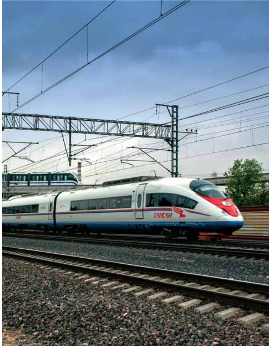
Vlak za velike brzine Sapsan

Vlakovi Lastočka su Siemensovi elektromotorni vlakovi Desiro koje u Rusiji lokalno proizvodi tvrtka Sinara. Te vlakove RŽD koristi u regionalnome prijevozu, a u njima su putnicima dostupni aparati za poslu-