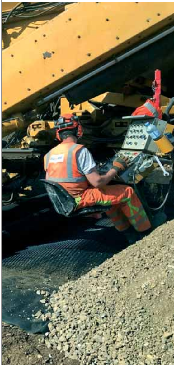
og sloja pružnim postrojenjem na dionici Sisak Caprag – Sunja

Na dionici Greda – Sisak tijekom osam 36-satnih tzv. zatvora pruge pružno postrojenje AHM tvrtke Swietelsky ugradilo je tamponski sloj debljine 40 cm u duljini od 5,9 km i s radovima će nastaviti tijekom stalnog tzv. zatvora pruge od sredine svibnja do 19. lipnja na dionici između Sisak Capraga i Sunje. Nakon što je između Grede i Siska strojno ugrađen novi tampon,