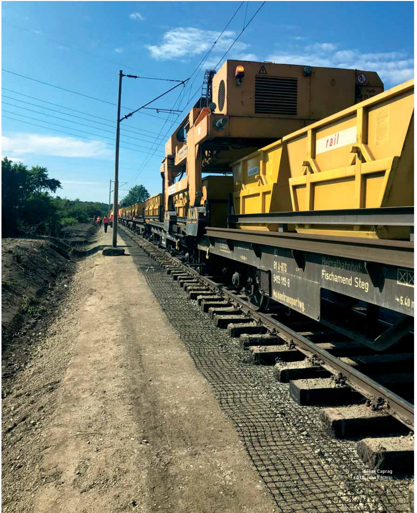
Sisak Caprag