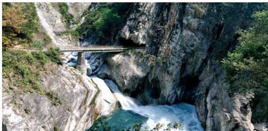
Hualien - NP Taroko