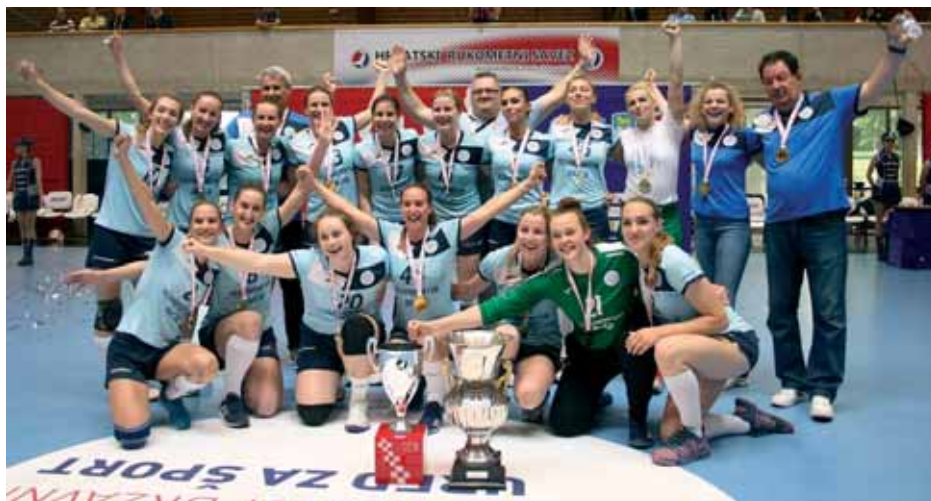
Rukometašice »Lokomotive« slave pobjedu u Kupu Hrvatske

golova, a izgubili s golom razlike. No možda nam se to vrati s kamatama.