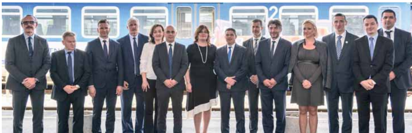
U kolodvoru Vinkovci

Ulaganja od gotovo 700 milijuna kuna putem tih prometnih projekata na istoku Hrvatske utjecat će na modernizaciju prometne mreže, smanjenje vremena putovanja te povećanje sigurnosti u prometu. Konačnom realizacijom navedenih projekata osigurat će se pozitivan učinak na veću iskoristivost javnog gradskog i prigradskog prijevoza, a time i unapređenje svakodnevnog života za više od 35 tisuća stanovnika Vinkovaca, ali i svih onih koji putuju Vukovarsko-srijemskom županijom.