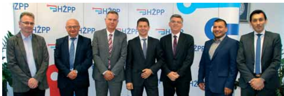
Predstavnici HŽPP-a i Končar INEM-a