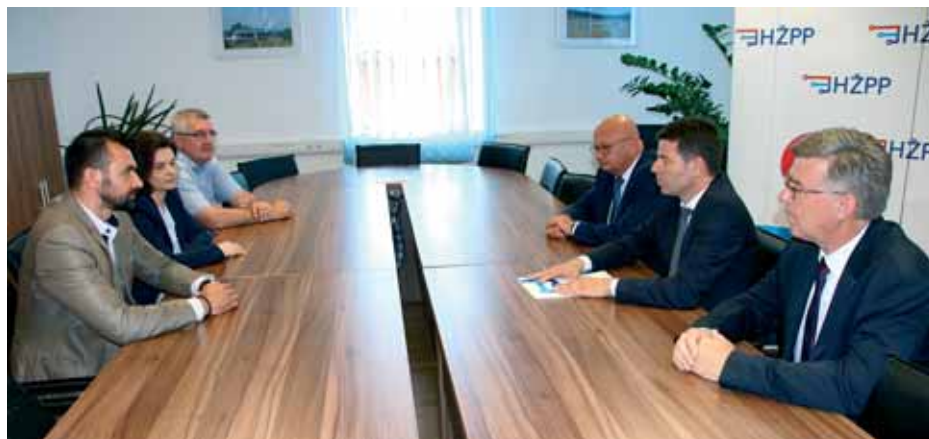
Predstavnici HŽPP-a i TŽV-a »Gredelj«

„Zahvaljujemo na ukazanome povjerenju. Vjerujem da ste zadovoljni kvalitetom poslova koje za HŽPP obavlja TŽV »Gredelj«. Za TŽV »Gredelj« svaki je ugovor iznimno važan, kako na domaćem, tako i