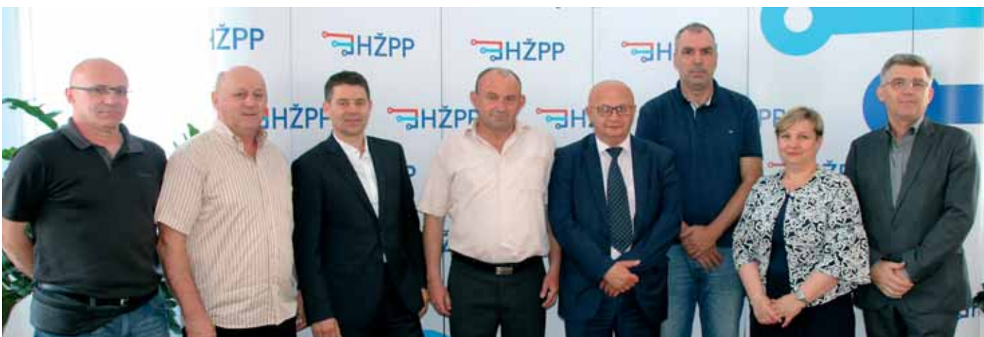
2. Predstavnici HŽPP-a i Saveza udruga branitelja radnika RH

Tom suradnjom osiguran je popust od 30 do 50 posto na putovanja u redovitim vlakovima na području RH za braniteljske udruge koje su članice Saveza udruga branitelja, a radi se o udrugama ZUBZH Zagrebački holding, UBIDR HŽ, UBIDR HŽ Rijeka, UDVRD Hrvatske šume, UB RIZ Odašiljači, UDVRD Klub Ina, UHB HEP 90-95, UHB Petrokemija, UDVDRSV Đuro Đaković i KUSDR-HPT.